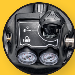
Regler mit Manometer