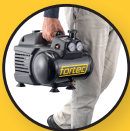
Leicht & kompakt