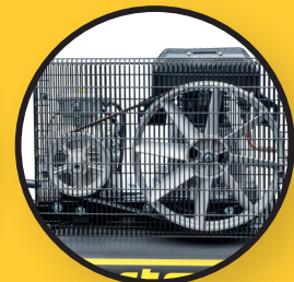
Starker zuverlässiger Keilriemenantrieb