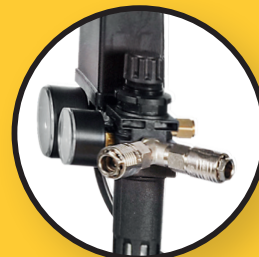
Qualitätskupplungen ARO 210