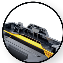
Halterung für Tanos und Sortimo System