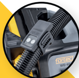
Bluetooth Fernbedienung für Akkugeräte