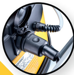
Steckdose für Schmutzwasserpumpe