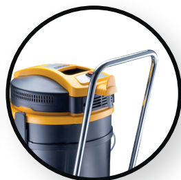
Poignée de guidage