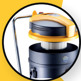
Filtre à cartouche