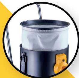
Filtre de protection moteur / Filtre textile