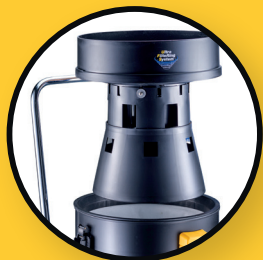
Système de flotteurs UFS