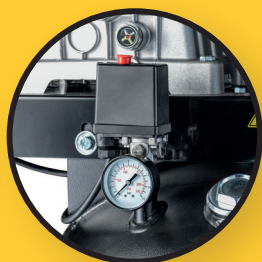
Condor Pressostat plus Druckmanometer