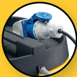
Steckdose für Schmutzwasserpumpe