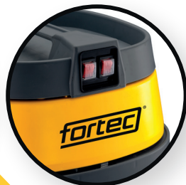
Doppelschalter / 2 Motoren