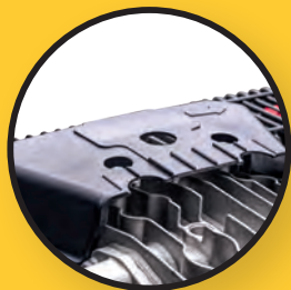
Abdeckung zur Geräuschdämmung