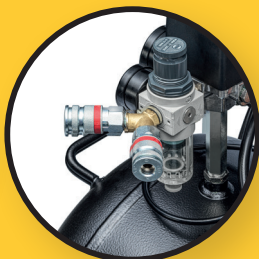
Qualitätskupplungen ARO 210 mit Druckregler