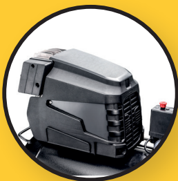
Abdeckung zur Geräuschdämmung