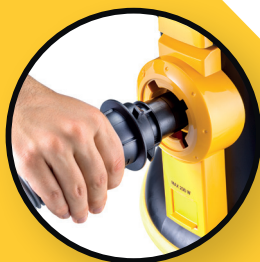
Raccord du tuyau d'aspiration