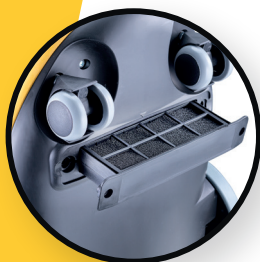
Filtre d'évacuation d'air