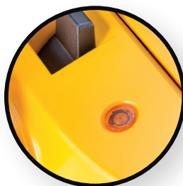
Indicateur de bourrage