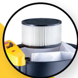
Filtre à cartouche