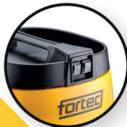
Doppelschalter / 2 Motoren