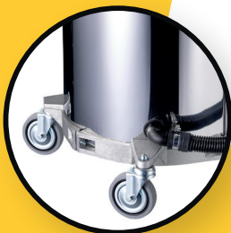
Ultra bewegliches Fahrwerk