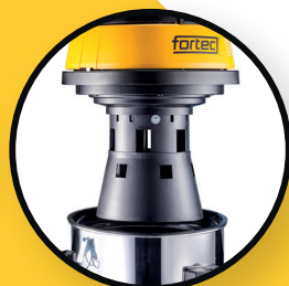
Système de flotteur fiable