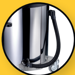
Flexible de vidange