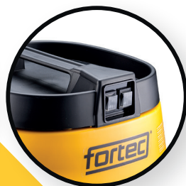
Double interrupteur / 2 moteurs