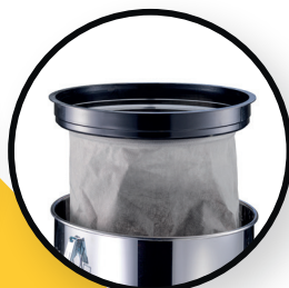
Filtre de protection moteur / Filtre textile