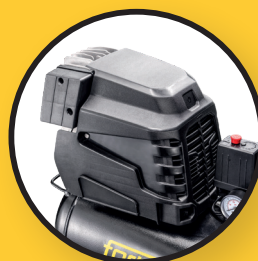
Abdeckung zur Geräuschdämmung