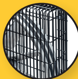
Double entraînement par courroie trapézoïdale pour un grand silence de fonctionnement