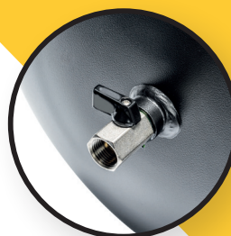
Raccordement direct côté chaudière