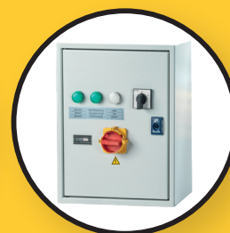
Externer Schaltkasten mit Stern-dreieck-Schaltung