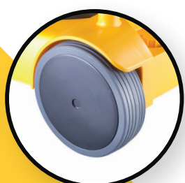
Roulettes arrière avec bandage caoutchouc