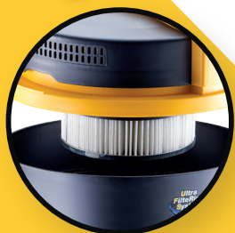
Filtre à cartouche