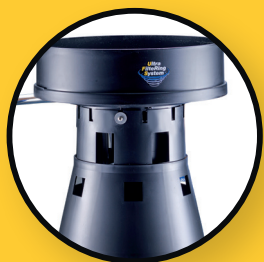
Système de flotteurs UFS