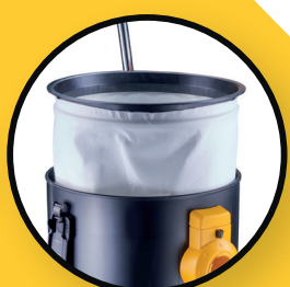
Filtre de protection moteur / Filtre textile