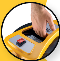
poignée de transport pratique