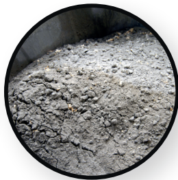
pour les cendres chaudes, les résidus de braises et les applications quotidiennes