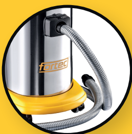
Tuyau d'aspiration en céramique, ignifugé