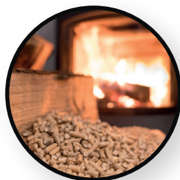
Tétine est ignifugée jusqu'à 200°.