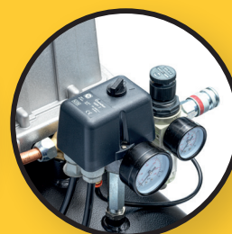
Druckregler mit Condor-Pressostat